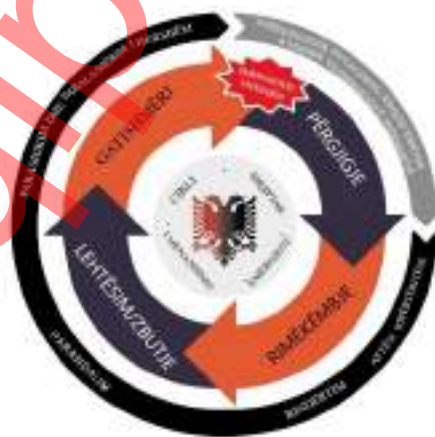
Figura 1: Cikli i Menaxhimit Emergjent

Qëllimi kryesor i Strategjisë Kombëtare për Zvogëlimin e Riskut nga Fatkeqësitë në Shqipëri (Strategjia) është të drejtojë aktivitetet dhe investimet e ardhshme të Shqipërisë për menaxhimin e riskut nga fatkeqësitë në një mënyrë tërësore dhe gjithëpërfshirëse. Shqipëria ka identifikuar rreziqet më të rëndësishme kombëtare natyrore dhe të shkaktuara nga njeriu që mund të shkaktojnë një fatkeqësi dhe ka analizuar dhe vlerësuar riskun nga fatkeqësitë në Vlerësimin Kombëtar të Riskut 2022. Hapi tjetër i natyrshëm sipas ciklit të menaxhimit të fatkeqësive dhe objekt i kësaj Strategjie është të përmbledhë të gjitha aktivitetet dhe investimet e menaxhimit të fatkeqësive në mënyrë që të planifikohet zvogëlimi i riskut të risqeve të analizuara, të parandalohet zhvillimi i risqeve të reja dhe të menaxhohet risku i mbetur.