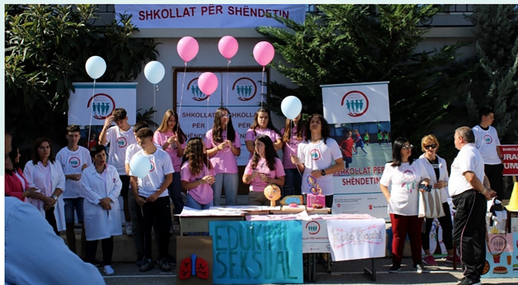
Fushata e Karavanit të Shëndetit, në Gjirokastrë, Tetor 2023

Nxënësit kanë patur një pjesëmarrje aktive në aktivitetet e fushatave të karvanit të shëndetit, duke përfshirë organizimin e panireve të ushqimit, duke avokuar për rëndësinë e ushqyerjes së shëndetshme, përfshirjen në aktivitete fizike dhe sportive, trajnimin e shëndetit mendor dhe bullizmin, si dhe pjesëmarrjen në nisma që promovojnë një mjedis të pastër dhe të sigurt.