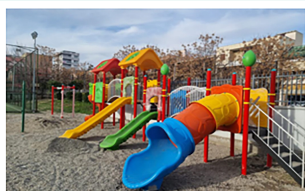
Shkolla “Qamil Guranjaku”, Elbasan

Gjithashtu, 115.979 individë janë arritur përmes mjeteve të komunikimit masiv duke përfshirë kanalet televizive dhe mediat digjitale, nëpërmjet platformave të ndryshme të mediave sociale.