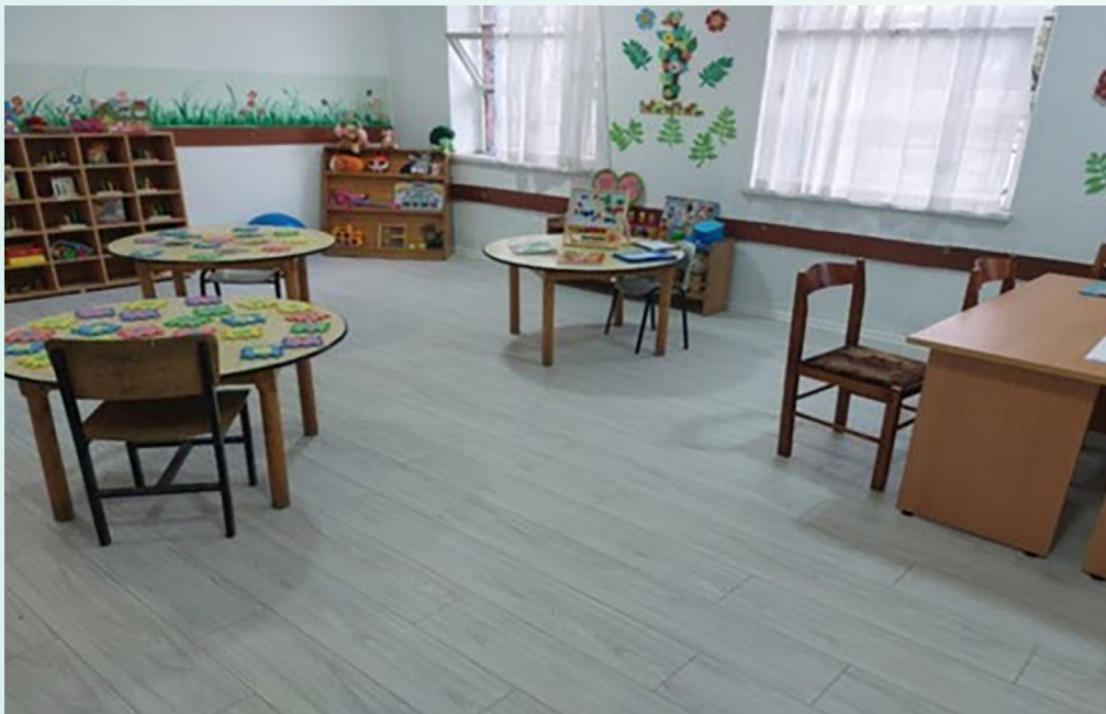
Qendra burimore, shkolla “Ndre Mjeda”, Shkodër

Gjithashtu, 9 qendra burimore (nga të cilat 3 janë në zonat rurale), janë krijuar ose rinovuar brenda shkollave për të shërbyer si burime të vlefshme informacioni si për nxënësit ashtu edhe për prindërit, me fokus të veçantë në plotësimin e nevojave të fëmijëve me kërkesa të veçanta.