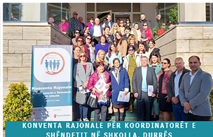
KONVENTA RAJONALE PËR KOORDINATORËT E SHËNDETTIT NË SHKOLLË, DURRËS