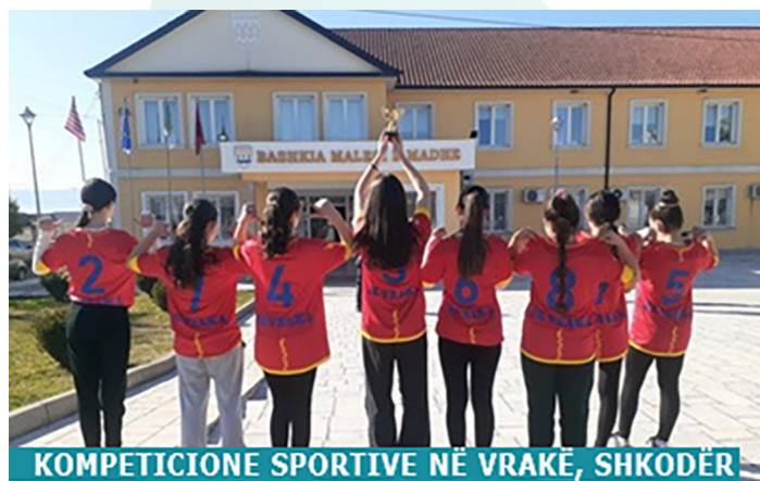
KOMPETICIONE SPORTIVE NË VRAKË, SHKODËR